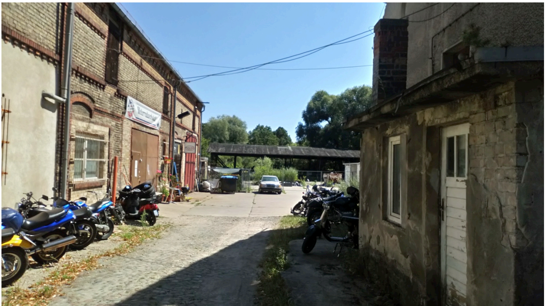
Abb. 2. Als Motorradwerkstatt genutzter Hof

Am Rande (außerhalb) des Plangebietes verläuft auf einer Teilfläche der Mühlenbecker Graben, der in seinem weiteren Verlauf in das Tegeler Fließ mündet. Zum Graben hin fällt das Gelände ab. Hier steht ein Weidengebüsch.