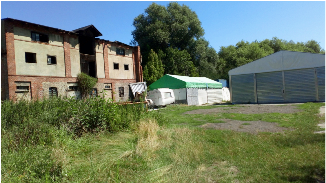
Abb. 1. Nutzung des Plangebietes