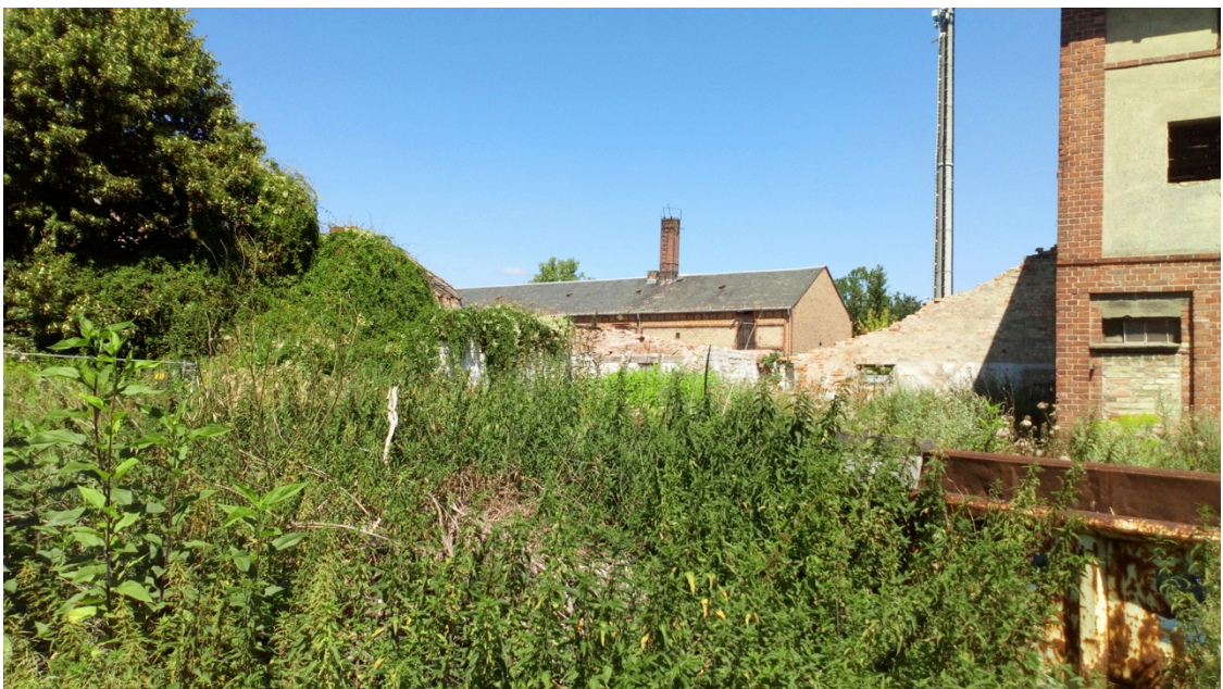
Abb. 4. Gebäuderuinen und Ruderalfluren aus überwiegend Brennnessel

Entlang der Hauptstraße steht eine Allee aus Linden und einzelnen Kastanien unterschiedlichen Alters. Die Allee ist nach § 29 BNatSchG geschützt. Nach § 30 BNatSchG geschützte Biotope sind im Geltungsbereich des Bebauungsplanes nicht vorhanden. Dies wurde von der Unteren Naturschutzbehörde in ihrer Stellungnahme vom 12.06.2019 bestätigt.