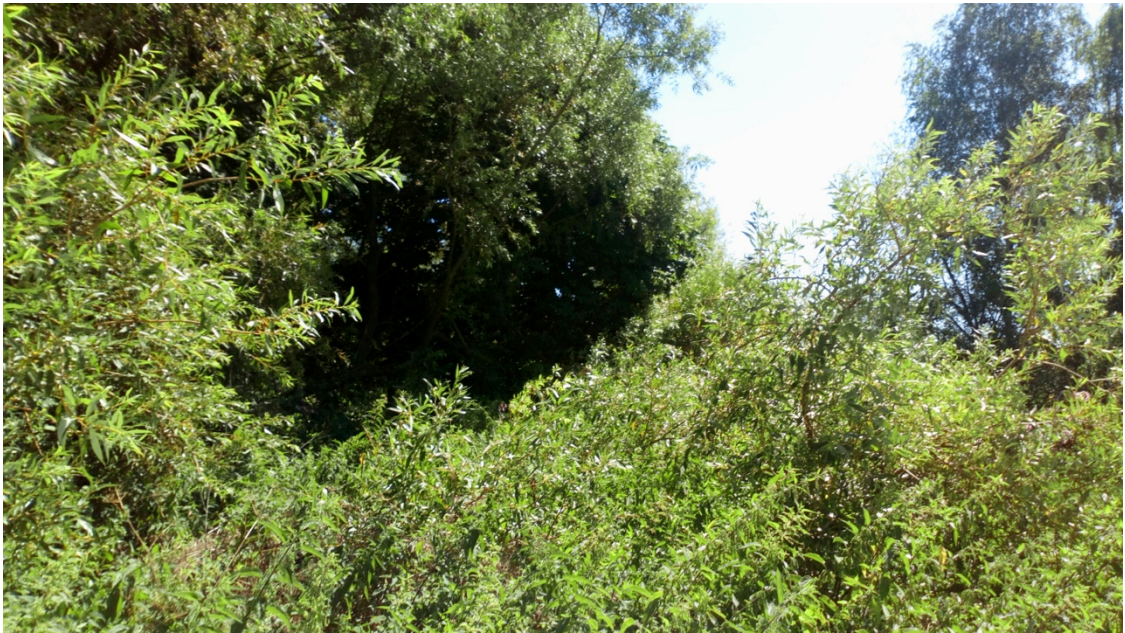
Abb. 3. Weidengebüsch am Mühlenbecker Graben