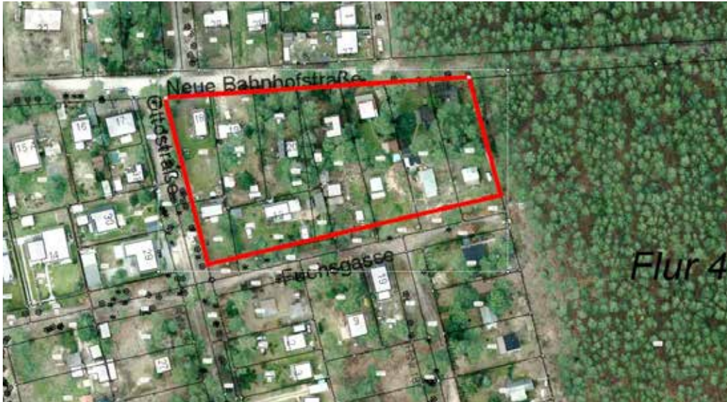
Lageplan auf der Grundlage der Liegenschaftskarte und eines Luftbildes mit Umgrenzung des Plangebietes